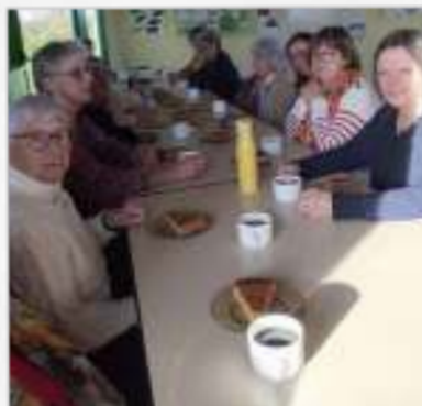
Association Plaisir des Arts

Renseignements mail : guengat.rando@gmail.com ou 06 98 20 11 87 ou 06 79 47 93 46