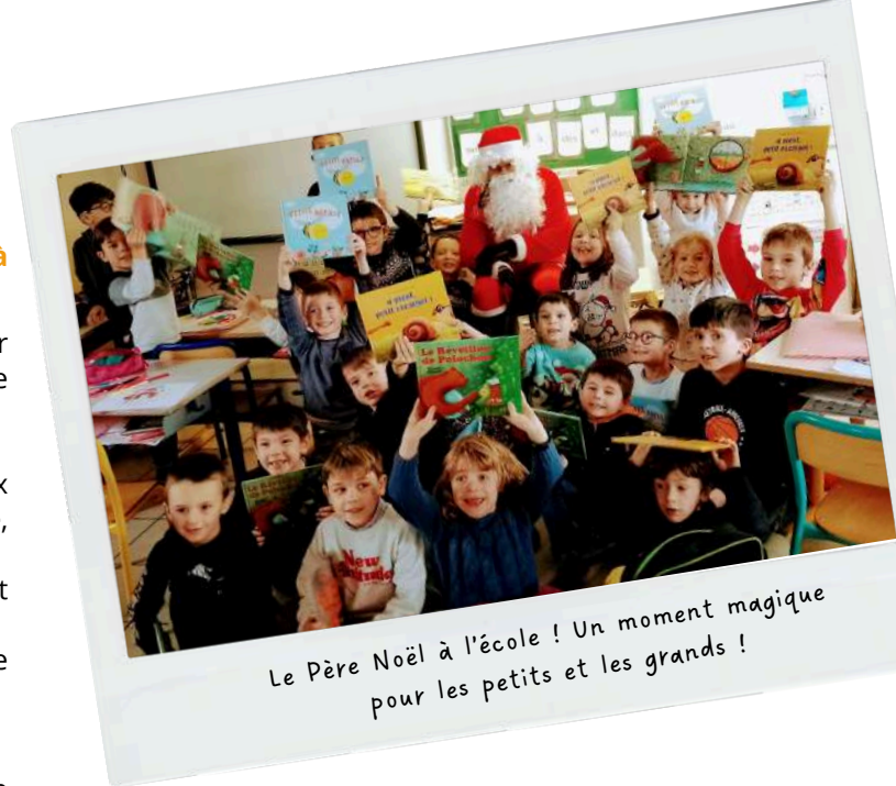
Le Père Noël à l'école ! Un moment magique pour les petits et les grands !

Rois et Reines étaient fiers de porter la couronne tout l'après-midi !