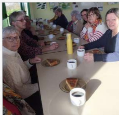
Association Plaisir des Arts

Renseignements mail : guengat.rando@gmail.com ou 06 98 20 11 87 ou 06 79 47 93 46