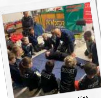
Formation aux gestes de premiers secours