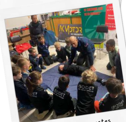
Formation aux gestes de premiers secours