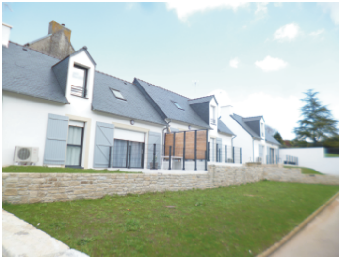
Locatifs occupés depuis décembre 2020 T3 (partie basse)