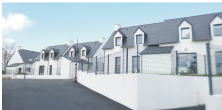
Maisons en location habitées à compter de début avril 2021, travaux de voirie effectués en mars 2021