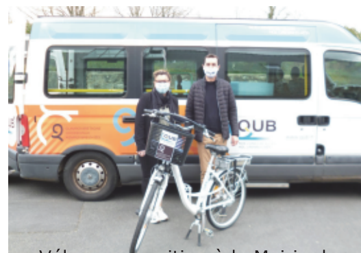
Vélo en exposition à la Mairie de Guengat

Pour plus d'informations, rendez-vous à l'agence commerciale QUB ou sur www.qub.fr