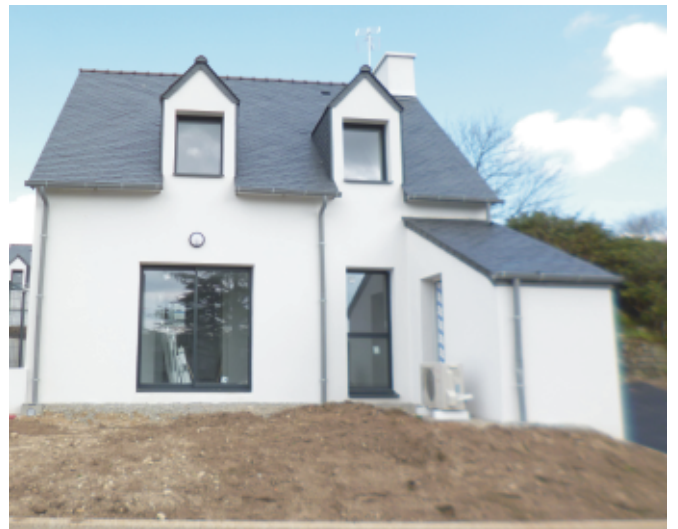
Logement occupé à partir de début avril (partie haute)