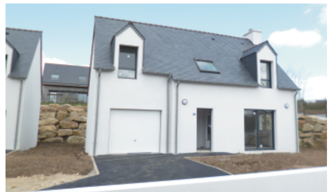
PSLA (Location-accession) occupé à partir de mai 2021

L'OPAC de Quimper Cornouaille a construit, près de la Mairie, 16 logements : 13 maisons en location et 3 PSLA (location-accession).