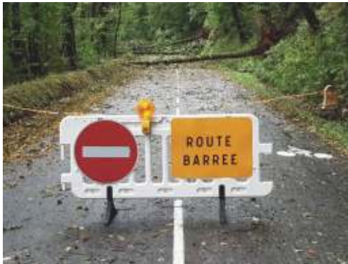
RD 63 : Loscoat à Guengat

Lors du passage de la tempête "ALEX" début octobre, la chute d'arbres a entraîné la fermeture de certaines voies communales et départementales en particulier sur le secteur du "Loscoat".