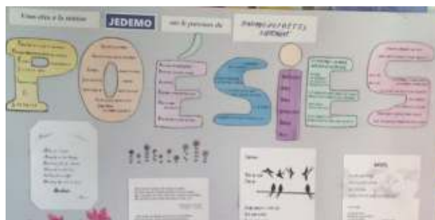
Un modèle des travaux réalisés par le club