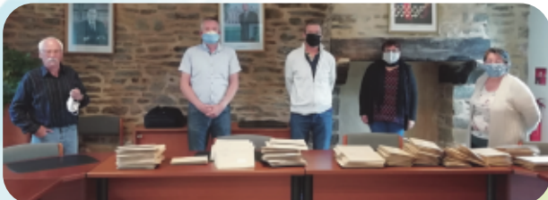
Photo prise lors de la préparation de la distribution des masques

A titre d'information, la boulangerie "Chez Cathy et Philco" et le bar-tabac "Le Bunny" vendent des masques en tissu au prix de 5 € pièce.