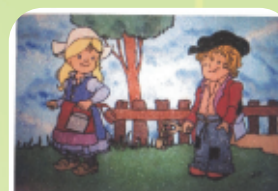
Denis Piton Tableaux de sables

Denis Piton Tableaux de sables Du 2 Février au 2 Mars 2019 Lors de cette exposition, il y aura des ateliers pour enfants qui pourront découvrir les tableaux de sable. Au Bunny 7 rue Malité 29080 Guengat