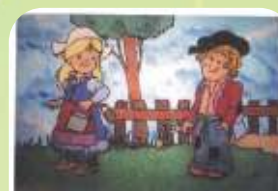
Denis Piton Tableaux de sables

Lors de cette exposition, il y aura des ateliers pour enfants qui pourront découvrir les tableaux de sable le 13 février et 16 février pour 4 enfants accompagnés de leurs parents.