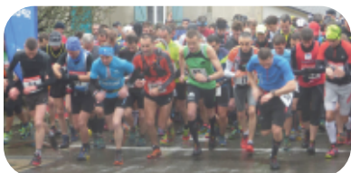
Top départ !

Le dimanche 21 février, les coureurs et les marcheurs ont foulé le sol de la campagne guengataise avec beaucoup de plaisir (Trail de 22 Kms, Foulées de 12 kms, une marche de 12 kms et une course pour les enfants). Une belle réussite !