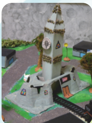
L'église et la gare...