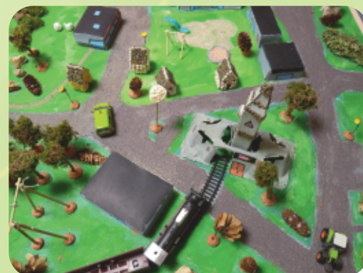
Le centre Bourg