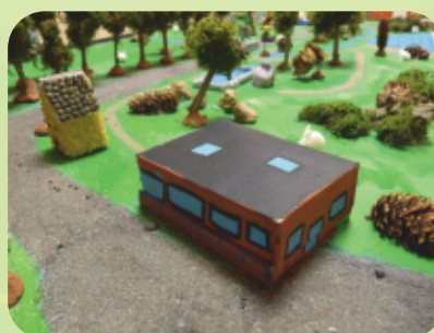
Le Pôle enfance