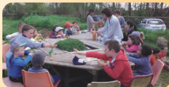
Goûter bio pendant les vacances de Printemps