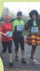
La bonne humeur Guengataise !