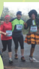
La bonne humeur Guengataise !